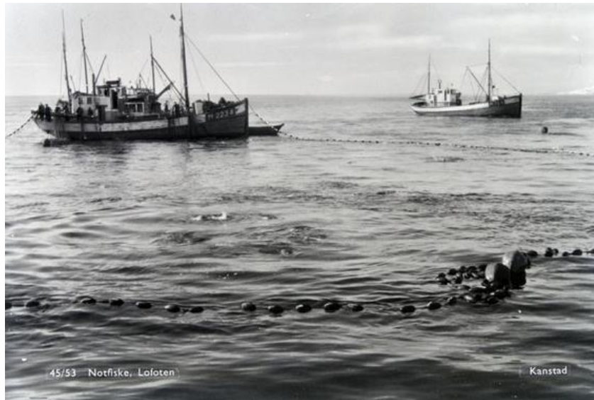
Bilde 1 Viser lukket not under fiske etter torsk i Lofoten

Snurpenot-navnet ble gjerne brukt om redskapet i notfisket frem til midten av 1960-årene. Inntil da ble det brukt lettåter (dory) til å sette nota fra moderfartøyet. Snurpenota ble dominerende i mange fiskerier, ikke bare etter pelagisk fisk, men også torsk.