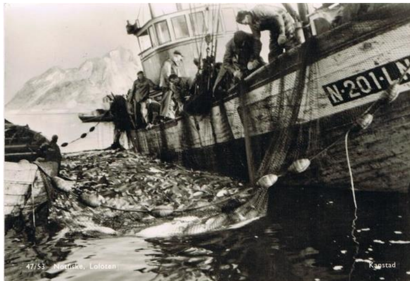
Bilde 2 MK "Langos" av Lødingen under tørking og ombordtaking av fangst fra not

Bilde 1 viser lukket not under fiske etter torsk i Lofoten. Legg merke til at fisken er i overflaten, men det er ingen flytere. Dette skyldes mest sannsynlig at svømmeblæren er punktert og at fisken har kvittet seg med overflødig luft.